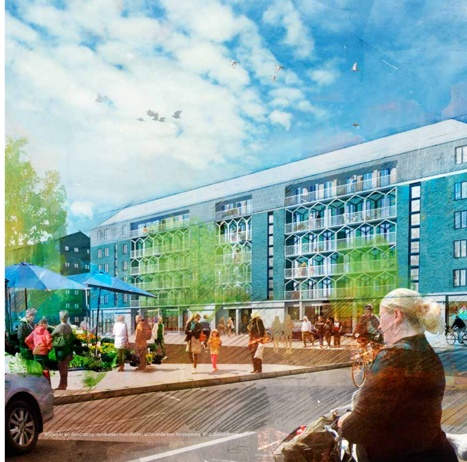
Bilden är en illustration. Avvikelser mot slutligt utförande kan förekomma. Bild: David Wiberg

Sundvall AB ett modernt kundorienterat byggföretag med verksamhet inom såväl traditionell entreprenadverksamhet som projektutveckling och nyproduktion av bostäder i egen regi.